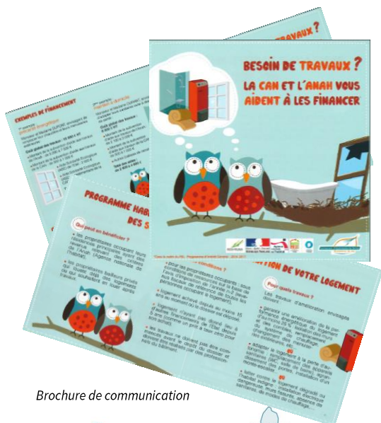
Brochure de communication

Le PIG de la CAN a comme objectif de lutter contre la précarité énergétique et l'habitat dégradé en Deux-Sèvres et de favoriser l'adaptation du logement à la perte d'autonomie.