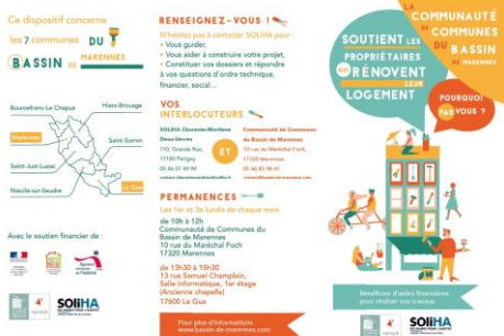
Brochure de communication